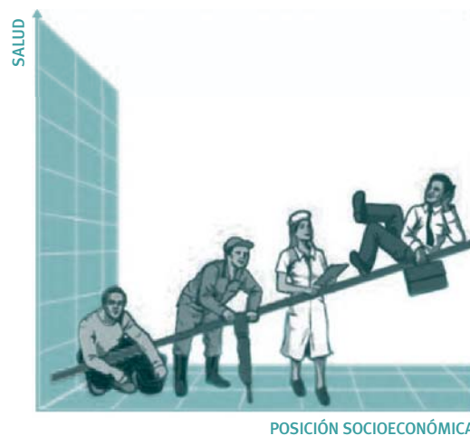
FIGURA 2. RELACIÓN ENTRE LA POSICIÓN SOCIOECONÓMICA Y LA SALUD

Fuente: «Reducing health inequity through a national plan of action». Tone P. Torgersen.