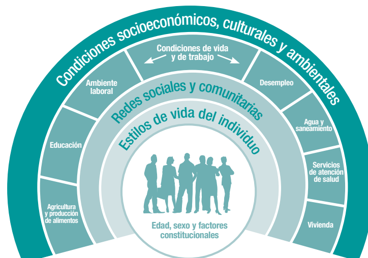
FIGURA 1. MODELO DE LOS DETERMINANTES SOCIALES DE LA SALUD

Las personas con más ingresos, mayor nivel educativo o mejor situación ocupacional tienden a vivir más y a tener menos problemas de salud. Esto es injusto para los que no tienen las mismas oportunidades sociales.